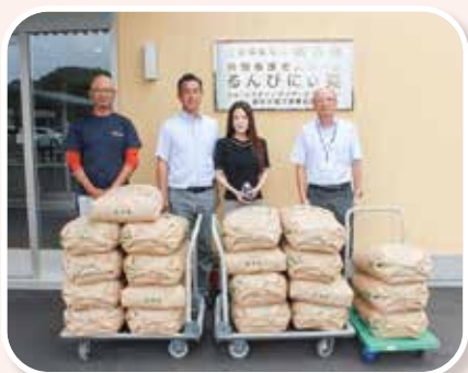
株式会社出雲かみしお本店様