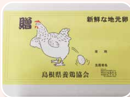
島根県養鶏協会（有限会社旭養鶏舎）様