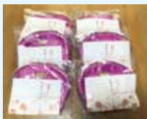
アルノア渚 松浦 渚 様