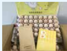
島根県養鶏協会 様