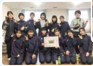
向陽中学校 バレー部の皆様