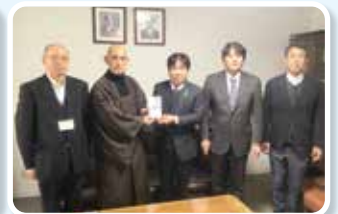
平田ロータリークラブ 様