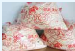
森脇 昭 様