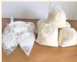
松山豆腐づくり部 様

しじみご飯／魚のとろろ蒸し 炊き合わせ／すまし汁 デザート盛り合わせ (メロン、バナナ、ミニケーキ)