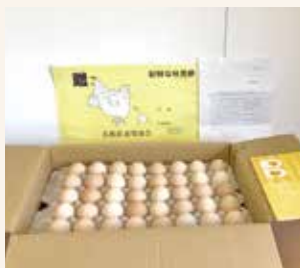
島根県養鶏協会 様 (有旭養鶏舎 様)